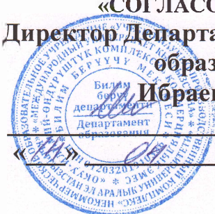
График проведения консультаций Итоговой Государственной Аттестации по Иностранному языку Центральный кампус