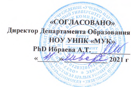
ГРАФИК ПРОВЕДЕНИЯ МОДУЛЕЙ по кафедре ЕНД на 2020-2021 учебный год 1, 2 курсы (ДиМП) на 2 полугодие