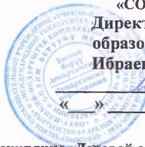
График проведения консультаций по дисциплине «Деловой английский язык» Восточный кампус