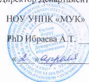
График проведения консультаций по дисциплине «История Кыргызстана»