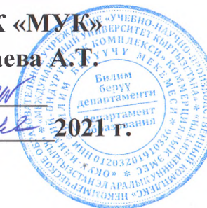
График проведения консультаций ГАК по дисциплине «География Кыргызстана» (Центральный кампус)